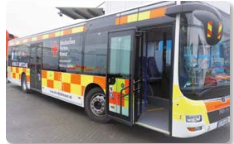
Der Impf-Bus des Gesundheitsamtes

Auf dem Richtsberg finden in diesem Jahr noch zwei aufeinanderfolgende Impfaktionen am Christa-Czempel-Platz statt: